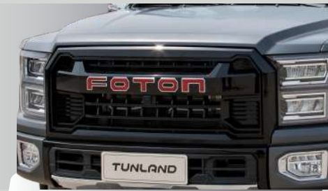
LOGO ROJO DEPORTIVO