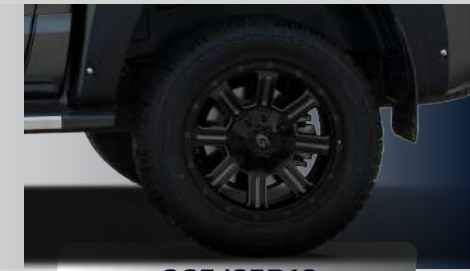
265/65R18 (rueda de acero)