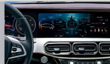
DOBLE PANTALLA 12.3+12.3" (Todas las funciones en un solo sitio)